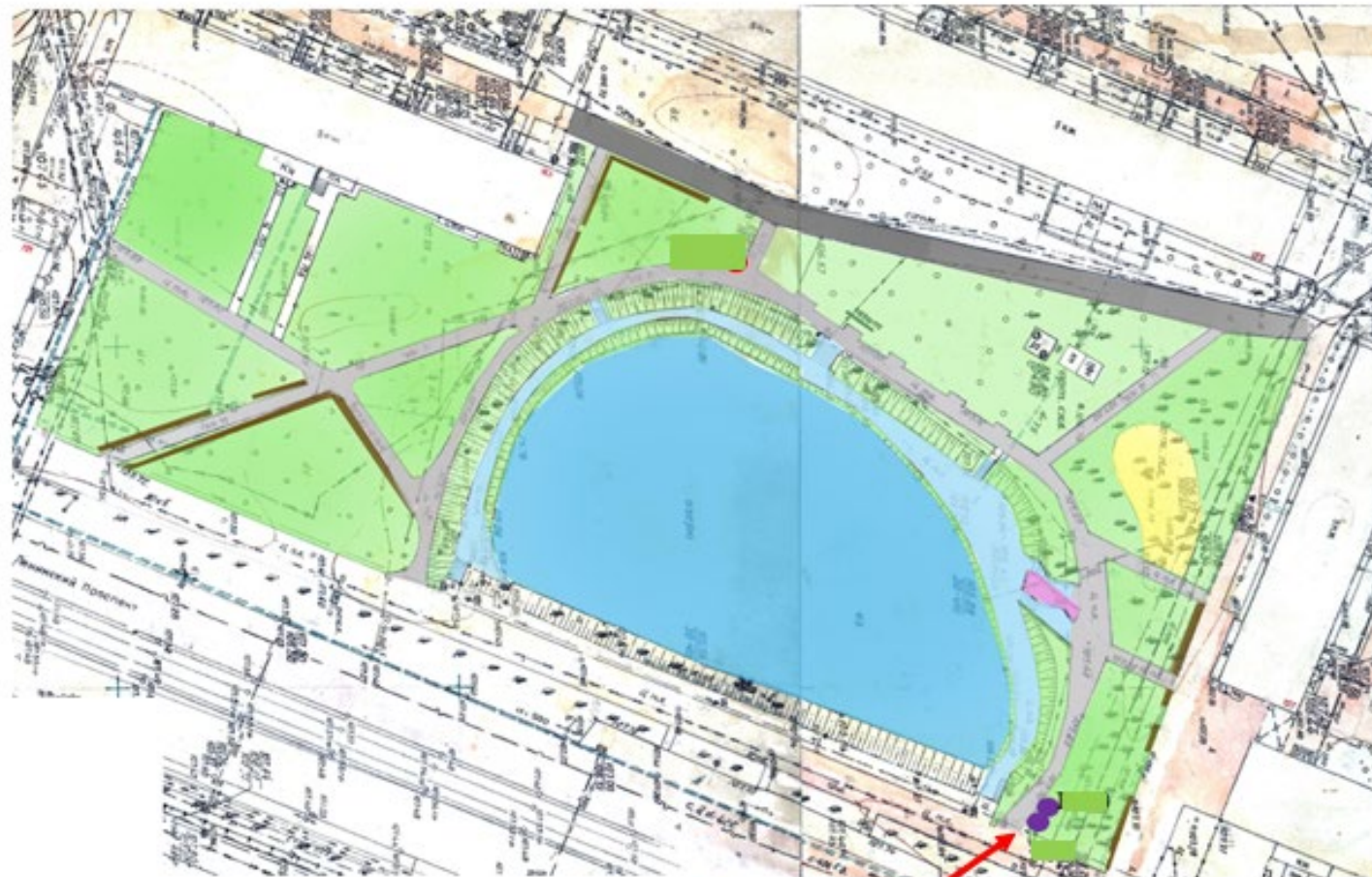
Схема размещения нестационарных торговых объектов: - I-C115 (объект сезонной торговли (торговый аппарат), 2 кв.м), - I-C116 (объект сезонной торговли (торговый аппарат), 2 кв.м). Железнодорожный район, Ленинский проспект, 123д, на территории сквера «У озера»